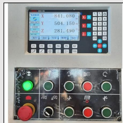
Reglas digitales en 3 ejes