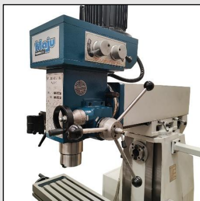
Cabezal de torreta giratorio y husillo horizontal